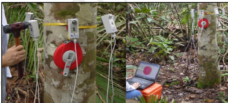
Figura 1. Procedimento de instalação e execução do Tomógrafo de impulso no fuste da árvore, e obtenção de imagem de uma seção transversal do lenho no computador.

Para obtenção das imagens tomográficas nas espécies selecionadas fixou-se na altura do DAP de cada árvore, sensores (numerados e dispostos no sentido horário) conectados entre si por cabo e bateria interligada ao computador portátil, que recebia o tempo percorrido pela onda e transformava em velocidades automaticamente pelo software do equipamento (Figura 01).