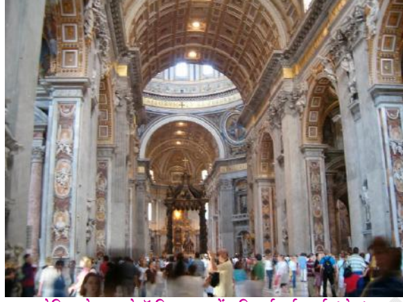
प्रेषित पेत्र याचे कॅथिड्रल - सेंट पीटर्सबर्ग चर्च (रोम)

ज्या पेत्राने प्रभु येशूच्या मृत्यूवेळी तीनदा त्याचा नकार दिला. त्याच पेत्राने आज येरुसलेमच्या मंदीराच्या आवारात हे भाषण दिले आणि जवळजवळ तीन हजार लोकांनी त्याच्या वचनाचा स्विकार केला. याच लोकांपासून पहिली प्रेषितीय मंडळी निर्माण झाली आणि पहिल्या मंडळीचा जन्म झाला. मंडळीचा खरा पाया पेत्र याने घातला.