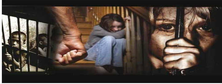
तालिका : 1 बालकों का कक्षावार विवरण

बाल अपराध एक सामाजिक समस्या है जिस पर बदलते हुये परिवेश में शोध की नितांत आवश्यकता है। सभी अनुसंधान का आधारभूत उद्देश्य ज्ञान की प्राप्ति है सामाजिक अनुसंधान का संबंध सामाजिक घटनाओं से होता सुविधानुसार 40 बच्चों का अध्ययन हेतु चयनित किया गया जिसमें मुख्य रेलवे परिक्षेत्र (द.पू.म.रे.) में आवासरत बालकों का चयन किया गया, तथ्यों आवश्यकतानुसार प्रतिशत विधि का भी उपयोग किया गया।