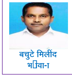
बचुटे मिल्दीद भगवान

इ.स.पूर्व ५३९ साली घोषित केलेली 'सायरस वृत्यचिती' हा मानवी हक्का विषयीचा पहिला लिखित दस्तऐवज मानण्यात येतो. भारतात सम्राट अशोकाच्या धोरणामुळे मानवी हक्कांना प्राधान्य मिळाले.