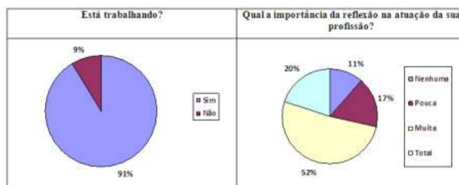
Figura 2 - Atual posição no mercado de trabalho e a importância da reflexão na sua profissão.